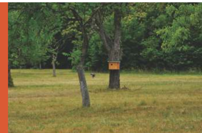
Gnezdilnica, v kateri se je izvalila nova generacija upkašev.