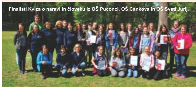
Finalisti Kviza o naravi in človeku iz OŠ Puconci, OŠ Cankova in OŠ Sveti Jurij.