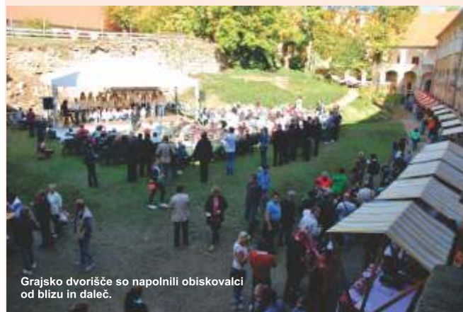
Grajsko dvorišče so napolnili obiskovalci od blizu in daleč.