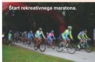
Štart rekreativnega maratona.