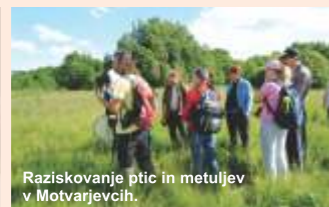
Raziskovanje ptic in metuljev v Motvarjevcih.