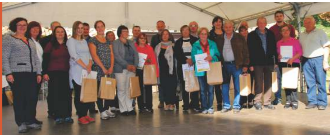
Prejemniki nagrad in priznanj akcij 4xNAJ in naziva Skrbnik narave v Krajinskem parku Goričko 2017 na Grajskem bazarju.

Na podlagi spremljanja in vsakoletnega štetja ptic ocenjujemo, da na Goriškem živi 20-40 parov smrdokaver. Za smrdokavo je zelo pomembno, da ji ohranimo naravna gnezdišča, kamor se vsako leto znova vrača. Zaposleni v JZ KPG smo zato opravili odstranitev bele omele z jablan, kjer upkaši gnezdiijo že več let. Veliki skovik, edina prava selivka med našimi sovami, je gnezdila v 21 gnezdilnicah. Mladiči so uspešno poleteli le iz 15-tih. V vseh gnezdilnicah so bili najmanj 3 mladiči. Pri preverjanju gnezd sta bili najdeni dve samici, obročkani leta 2015, ki sta pred dvema letoma gnezdili v bližini. Obema vrstama boste zelo pomagali s sajenjem dreves starih sort ter ohranjanjem mejic in travnikov. V gnezdilnicah so bili najdeni še skorci, poljski vrabci, sinice, pogorelčki in brglezi.