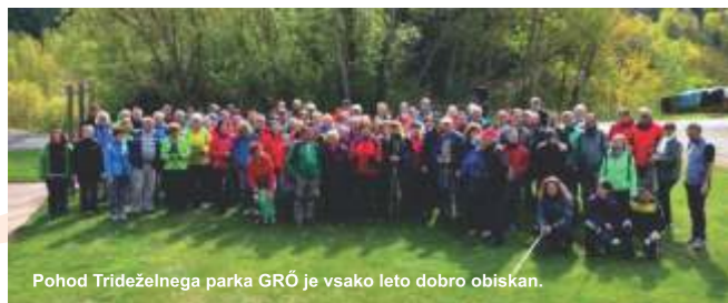
Pohod Trideželnega parka GRÖ je vsako leto dobro obiskan.

V okviru čezmejnih projektivnih aktivnosti, rekreativnih prireditev in sodelovanja s šolami veliko pozornosti namenjamo druženju v naravi. Aprila smo ob svetovnem dnevu Zemlje organizirali pohod Trideželnega parka Goričko-Raab-Őrség, kjer so pohodniki spoznavali raznolikost krajine ob avstrijsko-madžarski meji. Konec maja smo v sodelovanju s KUD Budinci pripravili družabne igre. Sedem ekip iz NP Őrség in KP Goričko se je pomerilo v domiselnih spretnostnih izzivih. V začetku septembra so ljubitelji kolesarjenja odkrivali razgibano kulturno krajino Goričkega in Madžarske na rekreativnem maratonu. Na skupnih prireditvah ob stičišču treh dežel se povezujemo in medsebojno bogatimo z izkušnjami in znanjem. Učenci višjih razredov goričkih šol so se pomerili v Kvizu o naravi in človeku. Mlajši učenci so ustvarjali v mednarodnem natečaju in obiskali Muzej na prostem Pityerszer v Narodnem parku Őrség na Madžarskem.