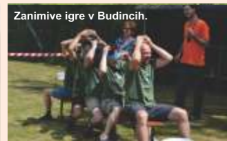
Zanimive igre v Budincih.