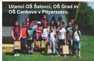
Učenci OŠ Šalovci, OŠ Grad in OŠ Cankova in Pityerszeru.