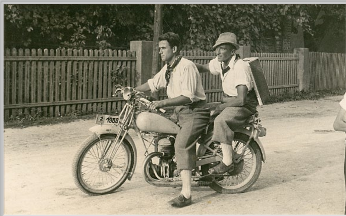
J. Purač, »Igor i Elemer sanjaju o motoru«, Beltinci, 1936. Zapis na hrbtini strani fotografije je napisal sam fotograf Purač. Neka druga roka pa je dodala še: »Prvi motor v B.«.