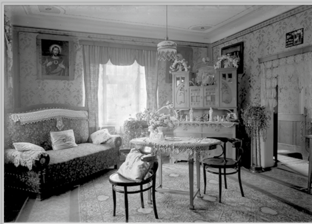
J. Purač, Secesijski interier meščanskega stanovanja v Murski Soboti (?), okrog l. 1933.