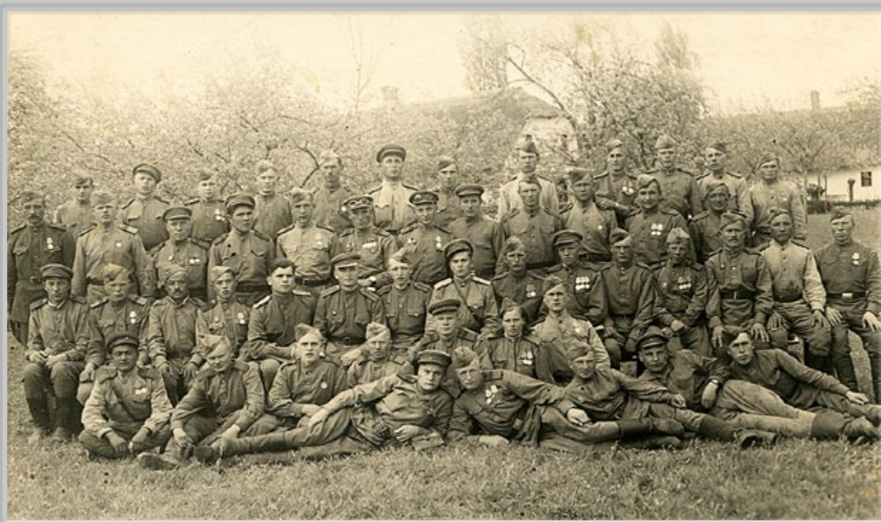
A. Sbüll, »Rusi prihajajo«, maj, 1945. Pripadniki ruske vojaške enote, ki se je spopadala z Nemci, ki so bili vkopani na pobočjih okrog Sv. Ane v današnji republiki Avstriji. Po pričevanju domačinov je aprila in maja 1945 v boju z Nemci padlo veliko število ruskih vojakov, ki so jurišali na dobro branjene položaje umikajoče nemške vojske.