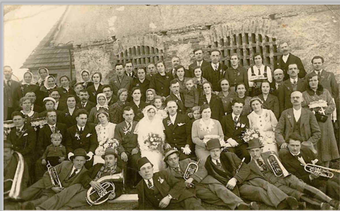
A. Sbüll, Poroka v Fikšincih, okrog l. 1937.