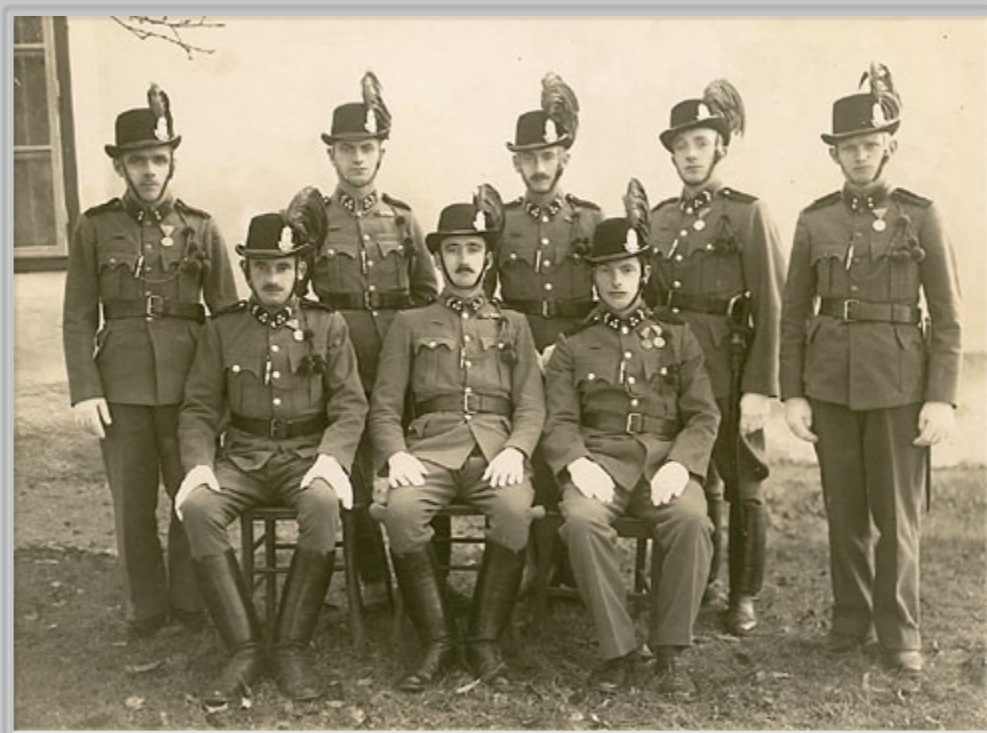
A. Sbüll, Skupinska fotografija madžarskih policistov (žandarjev) l. 1942/43 v Sotini (?). Od regularne madžarske vojske jih ločimo po značilnih temnih klobučkih s peresom.