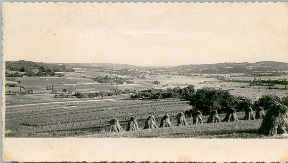
A. Sbiil: Goričko, pogled z Rdečega brega