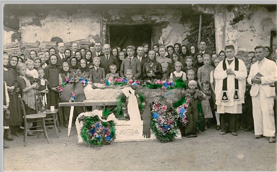
A. Sbüll, Pogreb v G. Slavečih (?), okrog l. 1938.