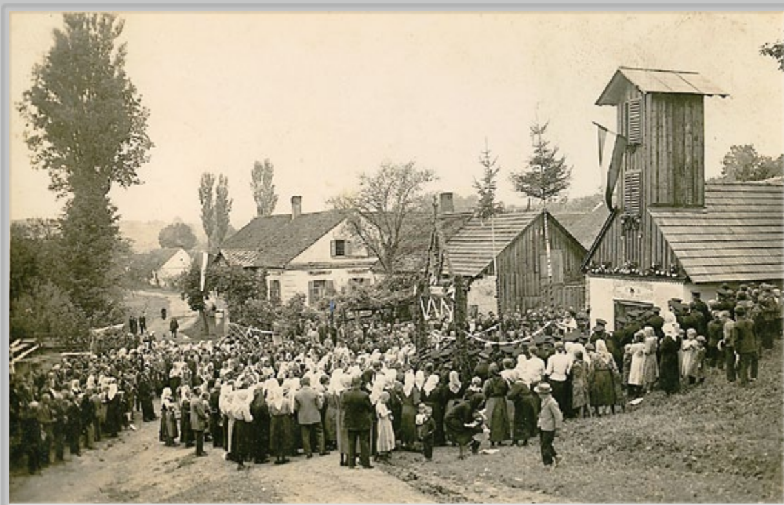
A. Sbiüll, Slovesnost ob otvoritvi gasilskega doma v Kramarovcih, l. 1938. Vas z večinskim nemškim prebivalstvom do leta 1945.