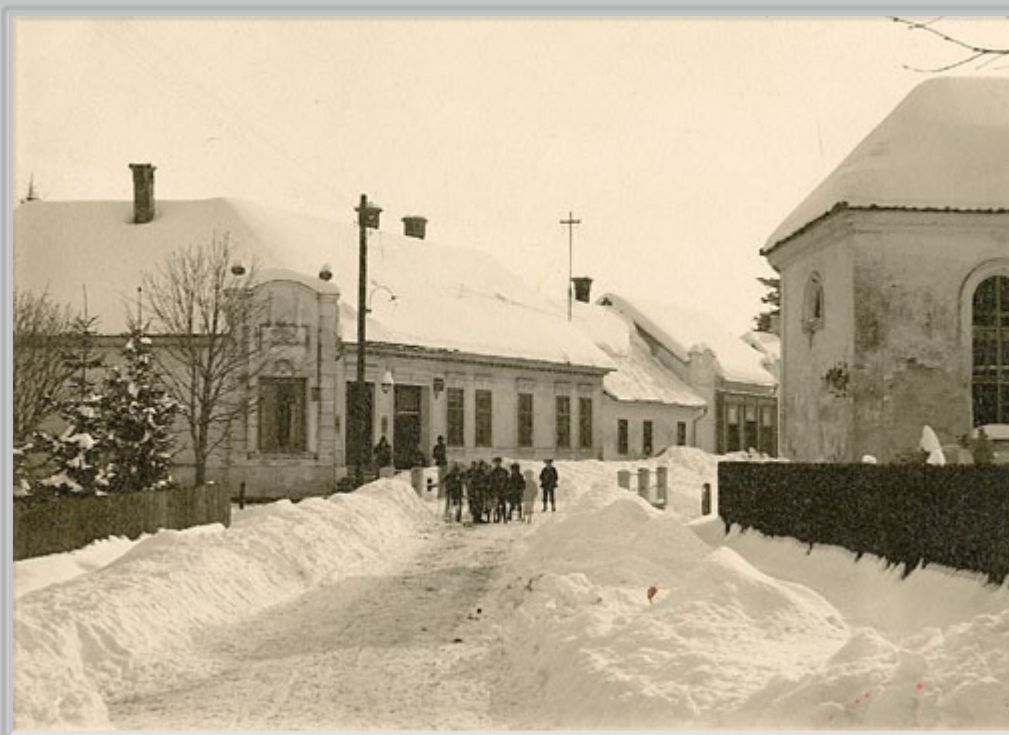
J. Purač, Mladinska ulica proti zahodu, Beltinci 1929/30. Z leve strani stara beltinska lekarna, ki jo je imel v času 1920–1931 v najemu lekarnar Rudolf Moszt. Na desni strani ulice, takrat že opuščena židovska molilnica (sinagoga), ki je bila zgrajena v 50. letih 19. stol. Pred l. 1940 jo kronisti že opisujejo kot ruševino s štrlečim zidovjem.