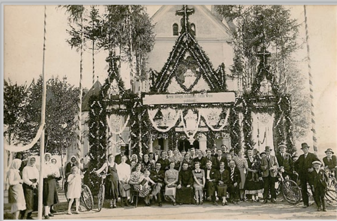
A. Sbüll, »Spomin sv. birme 1940 l. pri Sv. Jurju«, napis na hrbtni strani fotografije. Po pričevanju enega od udeležencev, so za izdelavo takšnega slavoloka potrebovali najmanj teden dni.