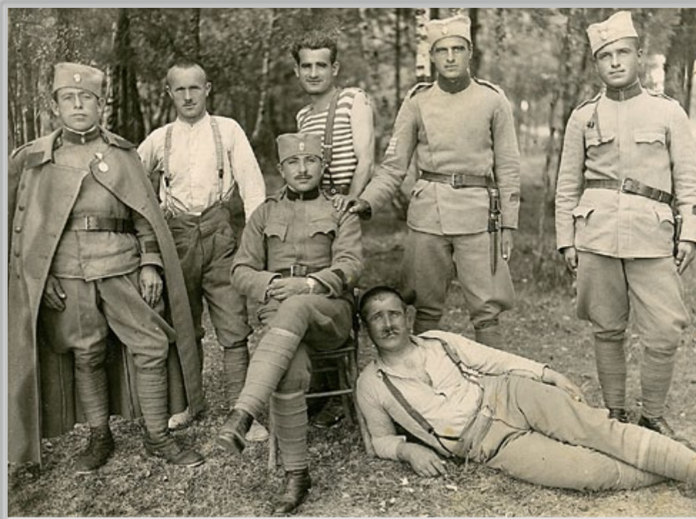
A. Sbüll, Vojaki mejnih enot (graničarji) Kraljevine Jugoslavije v sproščenem vzdušju. Okolica sotinske karavle okrog l. 1933.